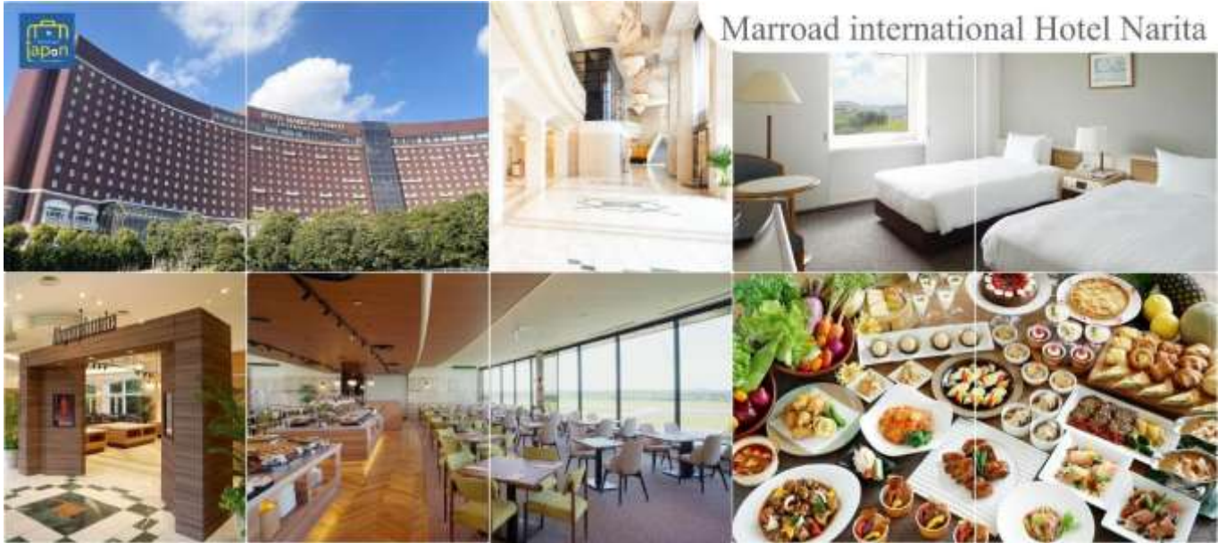
Marroad international Hotel Narita

วันที่หก ท่าอากาศยานนานาชาตินาริตะ – ท่าอากาศยานนานาชาติ ดอนเมือง