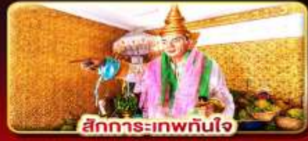
สิทธิการะเทพทันใจ