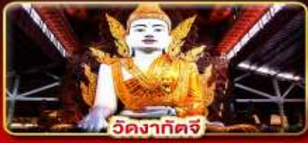
วัดงาทัดจี

สิทธิการะ 3 มหาบูชาสถาน พักบนอินทร์แวน 1 คืน