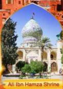
All Ibn Hamza Shrine