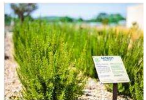
The Mediterranean Garden