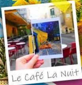
Le Café La Nuit