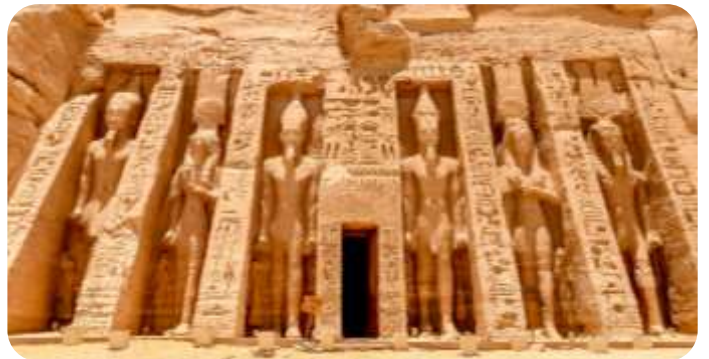
สมควรแก่เวลานำท่านเดินทางกลับเมืองอัสวาน