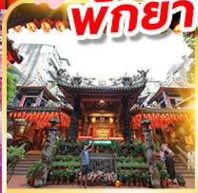
วัดเทียนโฮ่ว

ชมซากุระวัดเทียนหยวน พักย่านซีเหมินติง 2คืน