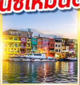
หมู่บ้านประมงเจินปิง