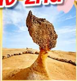
อุทยานเหย้าหลิว