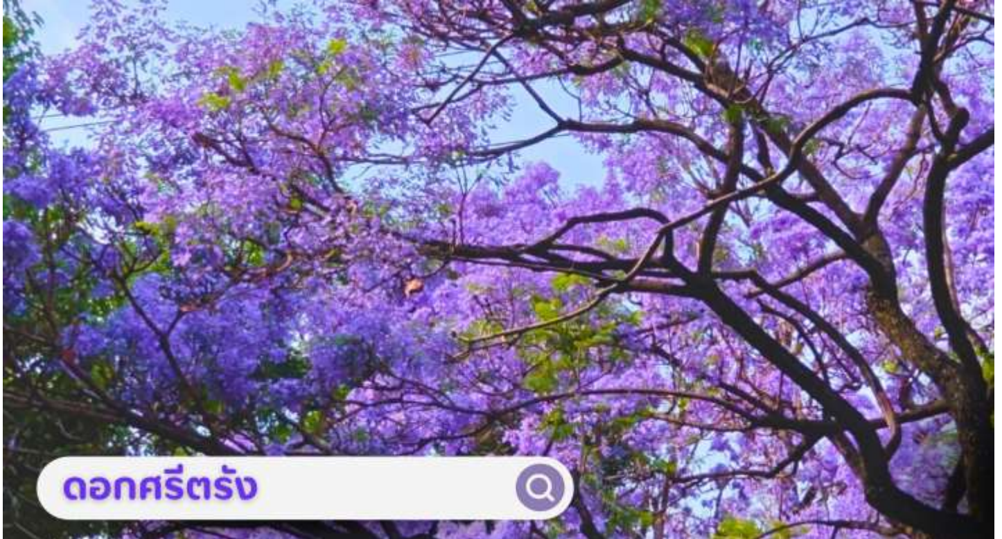
ดอกศรีตรัง

เดือนกันยายน: นำท่านชม ตลาดดอกไม้ไต้หวัน เป็นตลาดค้าส่งดอกไม้ที่ใหญ่ที่สุดของจีน เปิดทำการค้าตลอด 24 ชั่วโมง ไม่มีช่วงเวลาปิดทำการ โดยในปี 2566 ตลาดดอกไม้ไต้หวันมีปริมาณการซื้อขายดอกไม้โดยเฉลี่ยรวม 13,540 ล้านบาท คิดเป็นมูลค่า 13,570 ล้านบาท ถือเป็นตลาดค้าปลีก-ส่ง ผลิตผลทางการเกษตรที่ใหญ่ที่สุดในประเทศจีนอีกด้วย