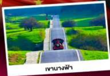
เขานางฟ้า