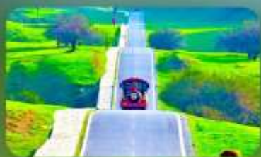
เขานางฟ้า