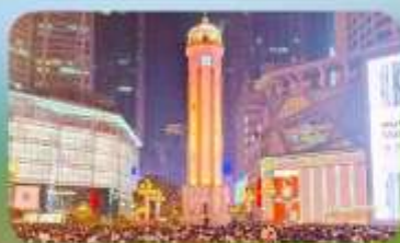
ถนนคนเดินเจียฟางเป่ย์