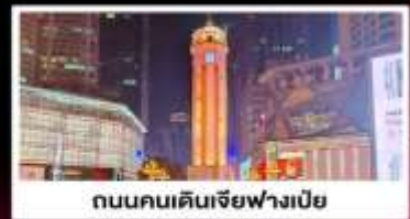
ถนนคนเดินเจียฟางเปี่ย