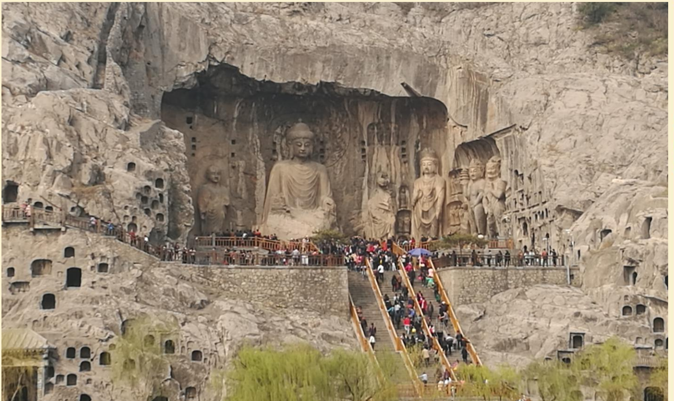
มีพระประธานสูง 17 เมตรสลักอยู่กลางถ้ำรายล้อมด้วยพระโพธิสัตว์และทวยเทพ

บาล รวมถึงการเขียนภาพจิตรกรรมลงบนผนังถ้ำ .....ปัจจุบันยูเนสโกประกาศให้หลงเหมินเป็นมรดกโลกทางวัฒนธรรมในปี ค.ศ. 2000 นำท่านชมถ้ำเฟิงเซียนชื่อ ซึ่งเป็นจุดไฮไลต์ ภายในถ้ำถ้ำ