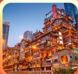
“ล่องเรือชมฉางชิ่งหงหยาดัง”