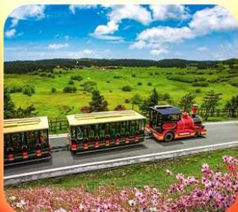
“อุทยานเขานางฟ้า”

บินตรงลงชิง • อุ่หลง หลุมฟ้าสะพานสวรรค์ • ระเบียบแก้ว • อุทยานเขานางฟ้า หงหยาดัง • นิ่งรถไฟทะลุคอก • ล่องเรือชมฉางชิ่งยามค่ำคืน • ศาลาประชาคม (ด้านนอก) มรดกโลกผาหินแกะสลักต้าจู้ • เมืองโบราณสี่ปาตี้ • วัดหลิวอัน • ตึกตะเกียบ