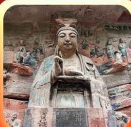
“ผาหินแกะสลักต้าจู้”