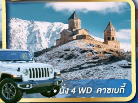
• นั่ง 4 WD คาซเบก