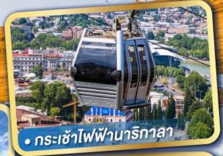
• กระเช้าไฟฟ้ามารีกาลา