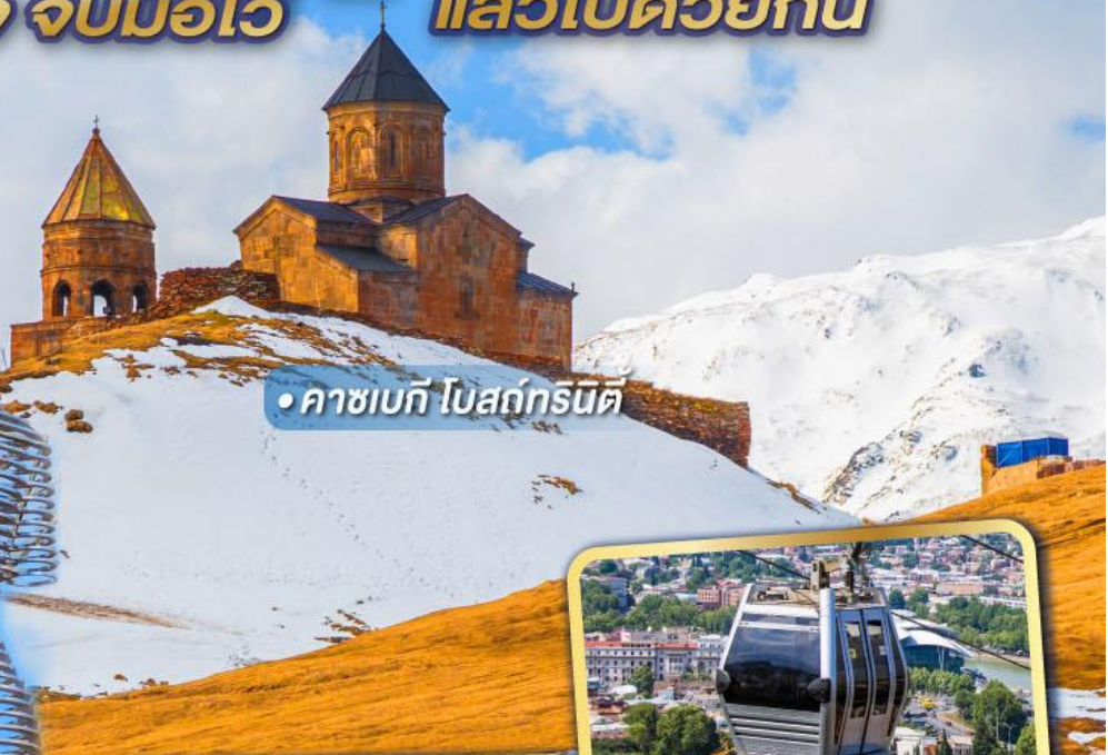
• คาซเบก โบสถ์กรนิต