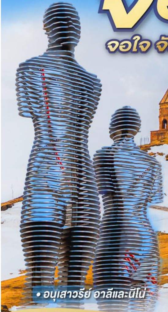
• อนุสาวรีย์ อาลีและนีโน่