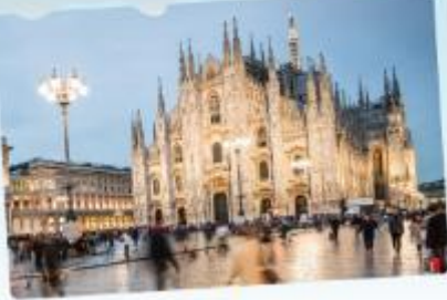
คูโอโม มิลาน