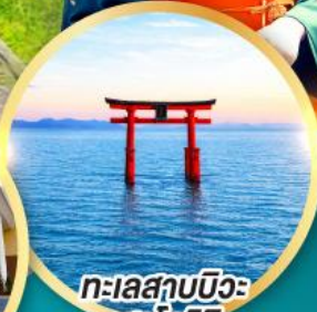
ทะเลสาบนิวะ เสาโทริอิ

เส้นทางสายอัลไพน์ทากายามา กำแพงหิมะ เพื่อนคู่ใจ