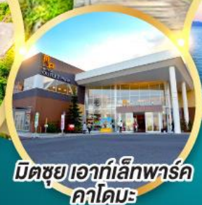
มิตซึยาเอากะอิเคะพาร์ค คาโดมะ