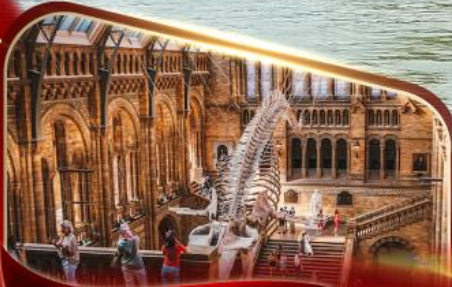
พิพิธภัณฑ์ประวัติศาสตร์ธรรมชาติ ลอนดอน