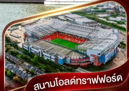
สนามโอลด์แทรฟฟอร์ด