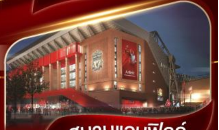
สนามแอนฟิลด์