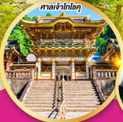
ศาลเจ้าโทโฮคุ