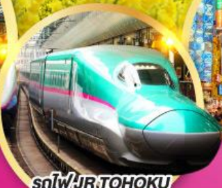
รถไฟ JR TOHOKU SHINKANSEN LINE