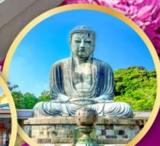
วัดโคโตคุอิน