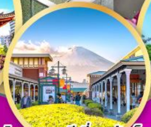
โทเทมบะ-พรีเมียมเฮ้าส์