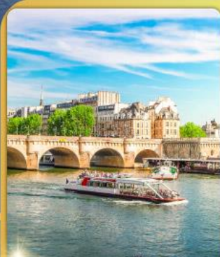
ล่องเรือแม่น้ำเซน