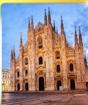
คูโอโมมิลาน