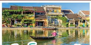
เมืองโบราณเฮอฮัน

! พักบนเขานาฮิลล์ 1 คืน ! สัมผัสอากาศเย็นตลอดปี สตรีฟรังเศสสุดคลาสสิก - นั่งกระเช้ายาวที่สุด สูบานาฮิลล์ สนุกสุดมันส์ไปกับสวนสนุก The Fantasy Park นมัสการเจ้าแม่กวนอิมองค์ใหญ่ที่สุดของเมืองดานัง - เช็กอินเมืองมรดกโลกฮอยอัน - สนุกสนานไปกับกิจกรรม!!นั่งเรือกระดิง หมู่บ้านกัมถาน เช็กอินร้านกาแฟ SON TRA MARINA CAFE - ไม่หลงร้านช้อปปิ้ง - อิ่มอร่อยกับบุฟเฟ่ต์นานาชาติ , หม้อไฟซีฟู้ด