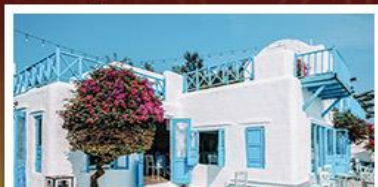
SON TRA MARINA CAFE