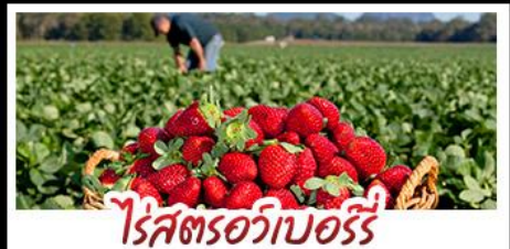
ไรศตรอบออร์รี่

คฤหาสน์เหวินเจิง - สวนชากรุงซิงเต่า ไรศตรอบออร์รี่ - โรงเบียร์ซิงเต่า