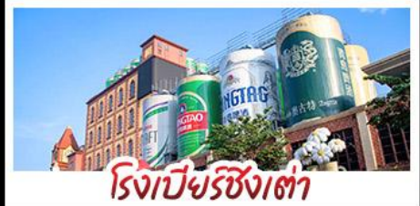
โรงเบียร์ซิงเต่า