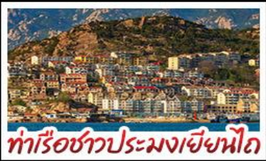
ทำเรือชาวประมงเยียนไก