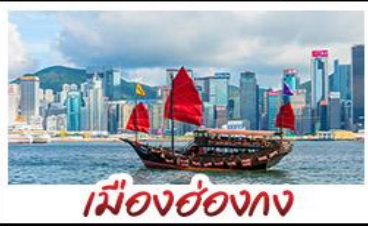
เมืองอ่องกง

เมืองเก่าซิงเต่า - วิวเมืองอ่องกง โรงเบียร์ซิงเต่า - ทำเรือชาวประมงเยียนไก