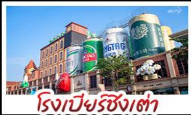
โรงเบียร์ซิงเต่า