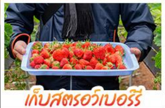
เก็บสตรอว์เบอร์รี่