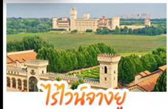
ไรไวน์ฟางยู