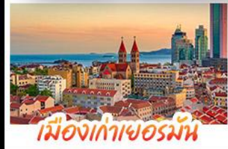
เมืองเก่าเยอรมัน

เมืองเก่าชิงเต่า - สลับกับเมืองโบราณหมิงสุ่ย เมืองเก่าเยอรมัน - ไรไวน์ฟางยู - สวนสตรอว์เบอร์รี่