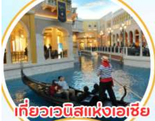
เที่ยวเวนิสแห่งเอเชีย