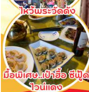
มือพิเศษ...เป่าอ้อ ซิฟู๊ด ไวน์แดง