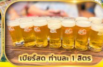
เบียร์สด ท่านละ 1 ลิตร