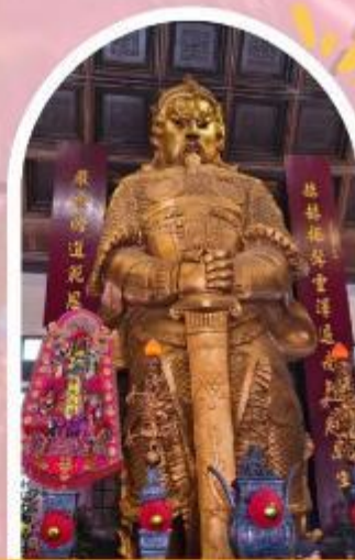
วัดแซกง ขอพรโชคกลาง การเงิน และธุรกิจ