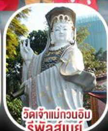
วัดเจ้าแม่กวนอิมรีพัลส์เบย์