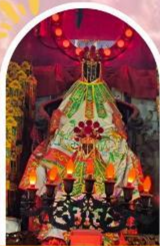
วัดเจ้าแม่กวนอิมอ่องฮำ ขอพรเรื่องเงิน ทรัพย์สิน และความมั่งคั่ง