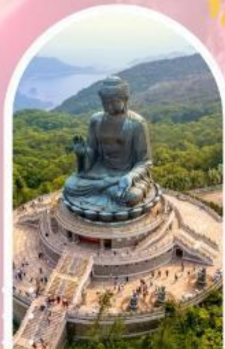
นั่งกระเชานองปิง นมัสการพระใหญ่ไป่หวลัน