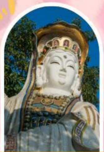
ริพลัสเบย์ รับพลังงานดี เสริมพลังดวงจัญ