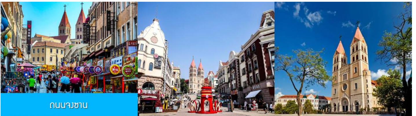
ถนนนางซาน

หลังอาหารเช้าท่านเดินทางชม สะพานจ้านเจียว เป็นแลนด์มาร์กประวัติศาสตร์คู่เมืองชิงเต่า สร้างเมื่อปี ค.ศ. 1891 มีลักษณะเป็นสะพานหินทอดยาวกว่า 440 เมตรสู่ทะเล ปลายสะพานมีศาลา ทรงแปดเหลี่ยมสีแดงที่โดดเด่น ซึ่งเป็นสัญลักษณ์บนฉลากเบียร์ชิงเต่า ขึ้นชื่อเรื่องวิวสวย รับลมทะเล ให้ท่านเก็บภาพบรรยากาศ จากนั้นนำท่านเดินเที่ยวชม ถนนจงซาน 中山路 ถนนที่เต็มไปด้วยกลิ่นอายยุโรป และถนนสายนี้มีบันทึกเรื่องราวมากกว่าศตวรรษของเมืองชิงเต่าไว้ ที่นี่เป็นศูนย์กลางการค้าแห่งแรกที่เต็มไปด้วยสถาปัตยกรรมสไตล์ยุโรปเก่าแก่ที่ได้รับอิทธิพลมาจากเยอรมัน ให้ท่านได้เดินเก็บบรรยากาศ และ เก็บภาพกับ โบสถ์เซนต์ไมเกิล (ด้านนอก) โบสถ์แห่งนี้ที่คู่รักนิยมมาถ่ายภาพงานแต่งงานกันมากที่สุดในเมืองชิงเต่า ให้ท่านถ่ายรูปเก็บภาพ จากนั้นเดินทางต่อ สู่ย่าน เมืองเก่าเยอรมัน ตรอกกว้างชิงหลี 广兴里 ตรอกชอกชอยที่เรียงรายไปด้วยอาคารสถาปัตยกรรมแบบ ผสมผสานจีนและอาคารสไตล์ยุโรป