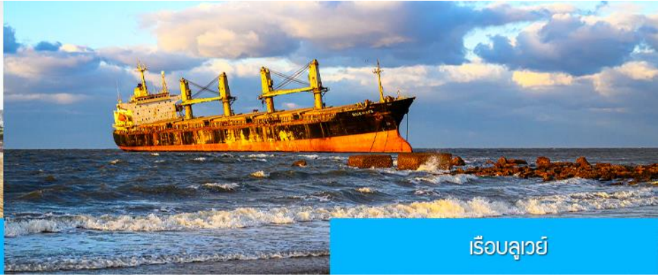
เรือบลูเวย์