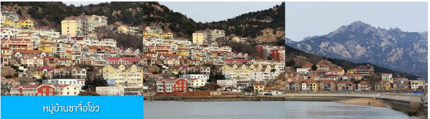
หมู่บ้านซาจื่อโขว่

เที่ยง รับประทานอาหารกลางวัน ณ ภัตตาคาร (มื้อที่ 7)