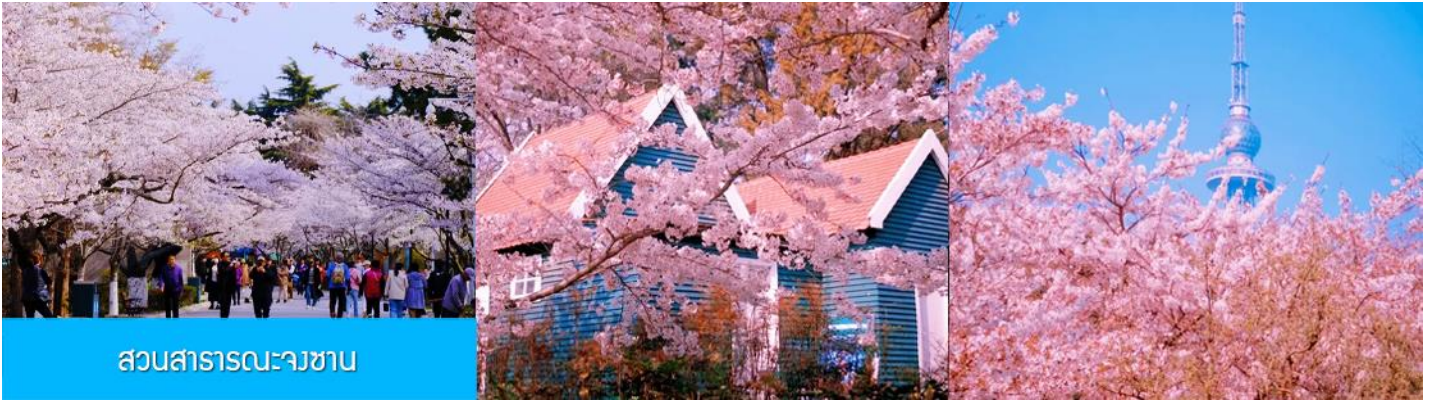
สวนสาธารณะจงชาน

ยุโรปในแผ่นดินจีน และเมืองที่มีวัฒนธรรมที่ผสมผสานทิวทัศน์ชายทะเลที่สวยงาม มีมนต์เสน่ห์อันเป็นเอกลักษณ์เฉพาะตัว (ใช้เวลาเดินทางประมาณ 3 ชั่วโมง)