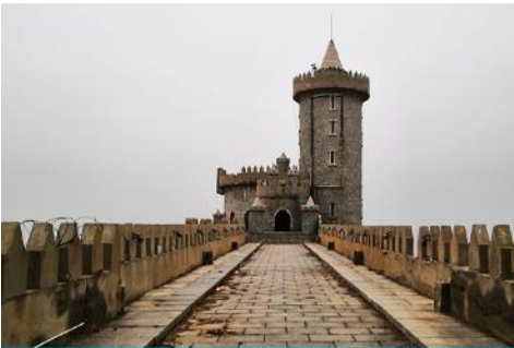
คาเฟ่อีสต