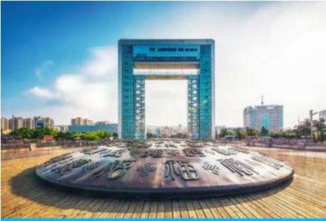
ประตูแห่งโชค

ครบรอบ 100 ปี ของการเปิดท่าเรือเว่ยไห่ จึงขนานนามว่าเป็น ประตูแห่งโชค ที่คอยต้อนรับนักเดินทางทุกท่าน โครงสร้างของประตูที่ตั้งตระหง่านโอบล้อมของท้องทะเลและเกาะหลิวกง อยู่เบื้องหน้า เป็นภาพที่สวยงาม ให้ท่านเก็บบรรยากาศเป็นที่ระลึก จากนั้นเดินทางสู่ภัตตาคาร