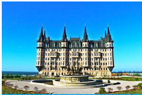
คฤหาสน์เหวินเจิง

เที่ยง รับประทานอาหารกลางวัน ณ ภัตตาคาร (มื้อที่ 1) นำท่านไปเยือนเมืองท่าสุดโรแมนติคสไตล์ยุโรป ท่าเรือชาวประมง ให้ท่านได้ชมสถาปัตยกรรมสไตล์อเมริกาเหนือ และ ยุโรป ที่ตั้งอยู่ในผืนแผ่นดินจีน ณ เมืองเยียนไถ เก็บบรรยากาศลมทะเล และเก็บรูปกับอาคารหลังคาสี่สไลเป็นฉากหลัง ที่เต็มไปด้วยมนต์เสน่ห์และความทรงจำที่สวยงาม ให้ท่านเก็บภาพความสวย