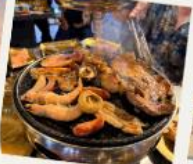
ปิ้งย่าง