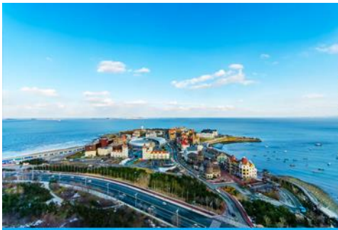
ท่าเรือชาวประมง

08.05 น. ถึงสนามบินเมืองเยียนไถ (เวลาที่ท้องถิ่นเร็วกว่าไทย 1 ชั่วโมง) นำท่านผ่านการตรวจตราเอกสารและรับสัมภาระเรียบร้อย นำท่านเดินทางโดยรถบัสปรับอากาศ เดินทางสู่เมืองเยียนไถ