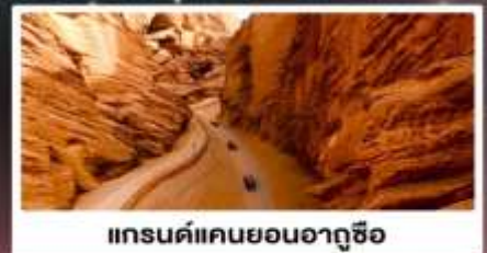
แกรนด์แคนยอนอาถูซื่อ