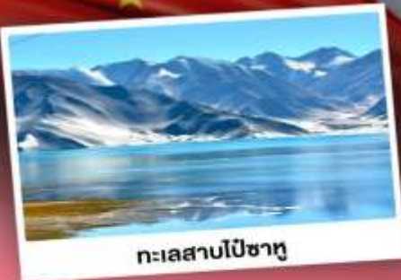
ทะเลสาบไปซาทุ

เปิดประตูสู่อารยธรรมพันปีแห่งซินเจียงใต้ ชมความสวยงามของหมู่บ้านดอกแอปเปิ้ล