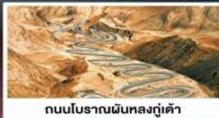
ถนนโบราณผืนหลงกู่เต้า