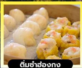
ตีมซาฮ่องกง