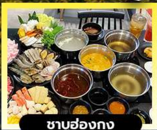
ซาบู่ฮ่องกง