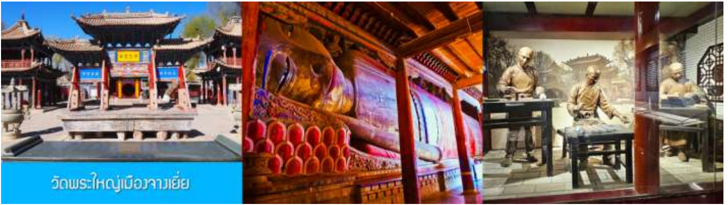
วัดพระใหญ่เมืองจางเยี่ย