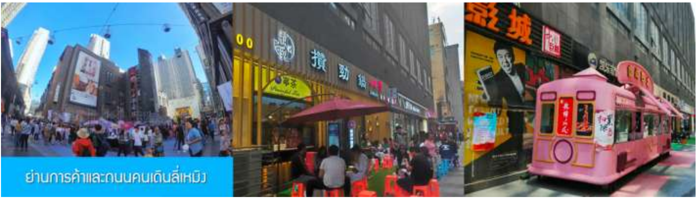
ย่านการค้าและถนนคนเดินลี่หมิง

หลังอาหารนำท่านสู่ ย่านการค้าและถนนคนเดินลี่หมิง 力盟商业步行街 ย่านการค้าทันสมัยที่มีห้างสรรพสินค้าขนาดใหญ่หลายแห่ง ถนนคนเดินที่คึกคักไปด้วยร้านค้าแบรนด์ท้องถิ่น ร้านอาหารพื้นเมือง ร้านสะดวกทานฟาสต์ฟู้ด ให้ความอิสระท่านเดินชท ช้อปปิ้ง ชิมอาหารพื้นเมืองเต็มที่