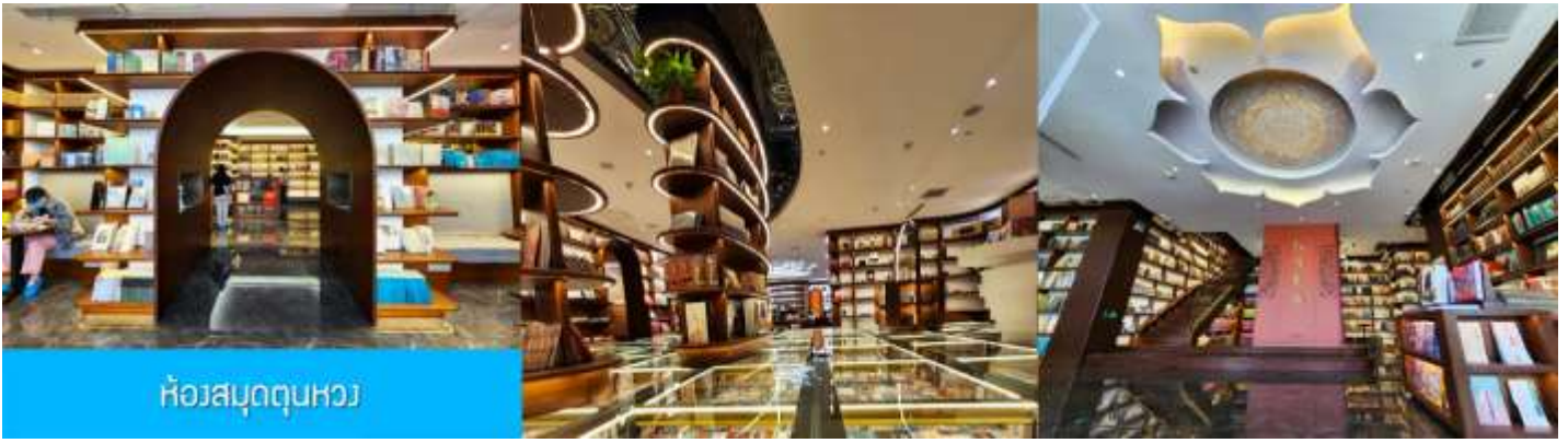
ห้องสมุดตุนหวง