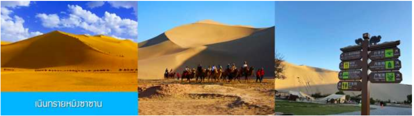
เนินทรายหมิงซาซาน