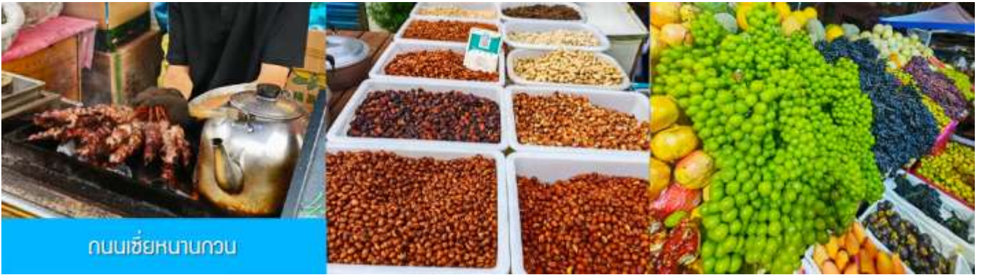
ถนนเซี่ยหนานกวน