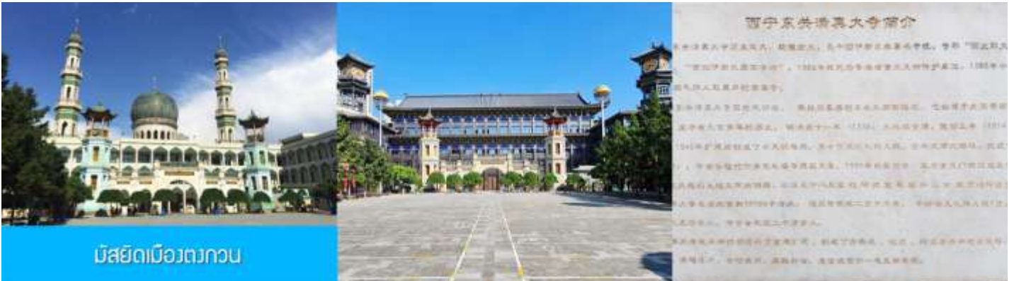
มัสยิดเมืองตงกวน

เช้า บริการอาหารเช้า ณ ร้านอาหารในโรงแรม (17)