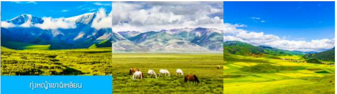
ทุ่งหญ้าเขาฉีเหลียน

จากนั้นนำท่านเดินทางโดยรถบัสสู่ทุ่งหญ้าฉีเหลียน (ระยะทาง 140 กม. ใช้เวลาเดินทางประมาณ 2 ชั่วโมง)