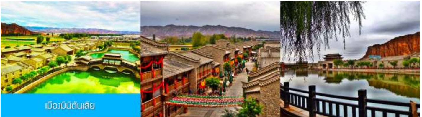
เมืองมินีสันตีสาย