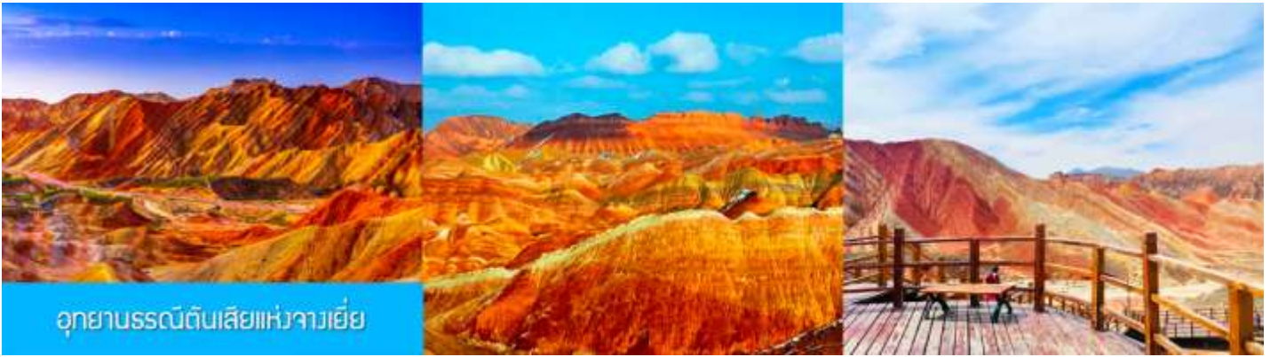
อุทยานธรณีสันตีสายแห่งจางเยี่ย