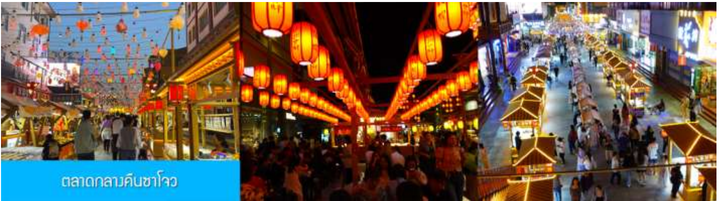
ตลาดกลางคืนซาโจว