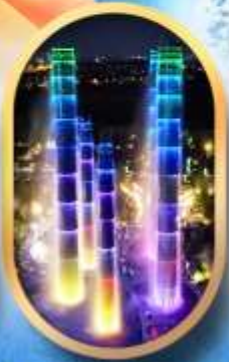
SKP Global Center