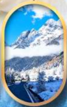
อุทยานสี่ครุณี