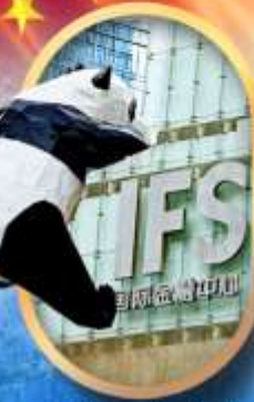
IFS หมีแพนด้าป็นตึก