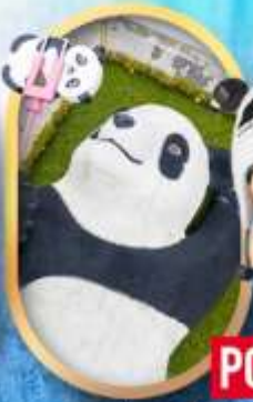
แพนด้าเซลฟี