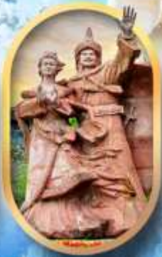
เมืองโบราณซงฟา