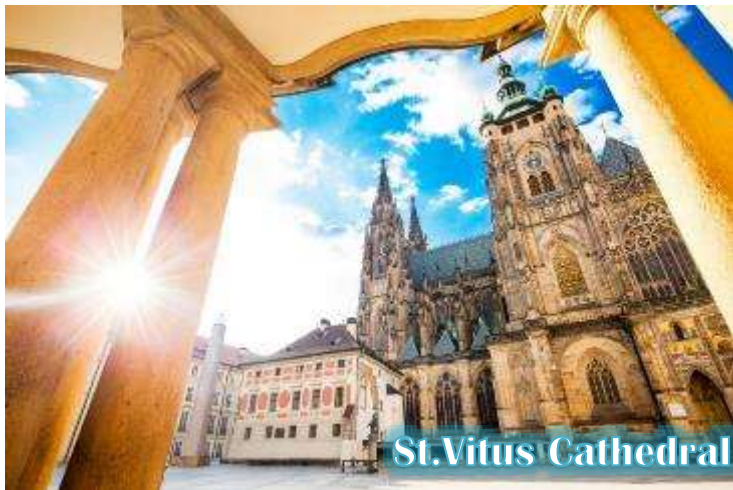
St. Vitus Cathedral