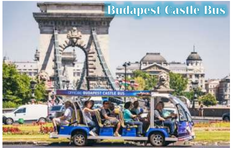
Budapest Castle Bus

บูดา Castle Hill *เนื่องจากตัวปราสาทตั้งอยู่บนเนินเขา การเดินทางโดยรถไฟไฟฟ้า จะเพิ่มความสะดวกสบายให้กับท่าน โดยรถไฟไฟฟ้าจะจอดรับและส่งตามจุดต่างๆ ในย่านเมืองเก่า ไม่ต้องเดินเท้าเป็นระยะทางไกล* จากนั้นนำท่านเดินชมความงดงามของเมืองเก่ารอบๆปราสาทบูดา ที่เริ่มมีการก่อสร้างมาตั้งแต่ปี ค.ศ.1265 และต่อเติมปรับปรุงมาโดยตลอด จนกระทั่งปัจจุบัน โดยตัวอาคารในปัจจุบันเราจะเห็นเป็นสไตล์บาโรค ที่ดู