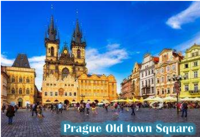
Prague Old town Square