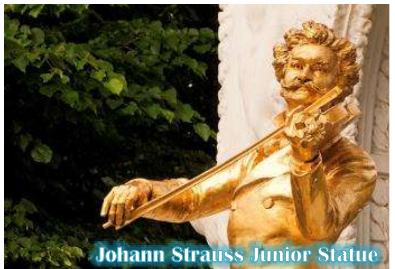
Johann Strauss Junior Statue

เช้า บริการอาหารเช้า ณ ห้องอาหารของโรงแรม นำท่านออกเดินทางเข้าสู่ใจกลาง “กรุง เวียนนา” (Vienna) ผ่าน “ถนนวงแหวน” Ring Strasse ซึ่งเป็นที่ตั้งของ โรง อوبرาการ์ (โอเปร่าเฮาส์), พระราชวังฮอฟบวร์ก, อาคาร รัฐสภา, ศาลาว่าการ, มหาวิทยาลัยเวียนนา, โบสถ์ประจำเมือง, ศาลสูง ฯลฯ เดินทางสู่ “สวนสาธารณะสตัดท์ปาร์ค” สวนสาธารณะอัน ร่มรื่นใจกลางเมือง ชม “ อนุสาวรีย์ โยฮัน สเต ร้าวส์ จูเนียร์ ” Johann Strauss ศิลปินที่มี ชื่อเสียงก้องโลก