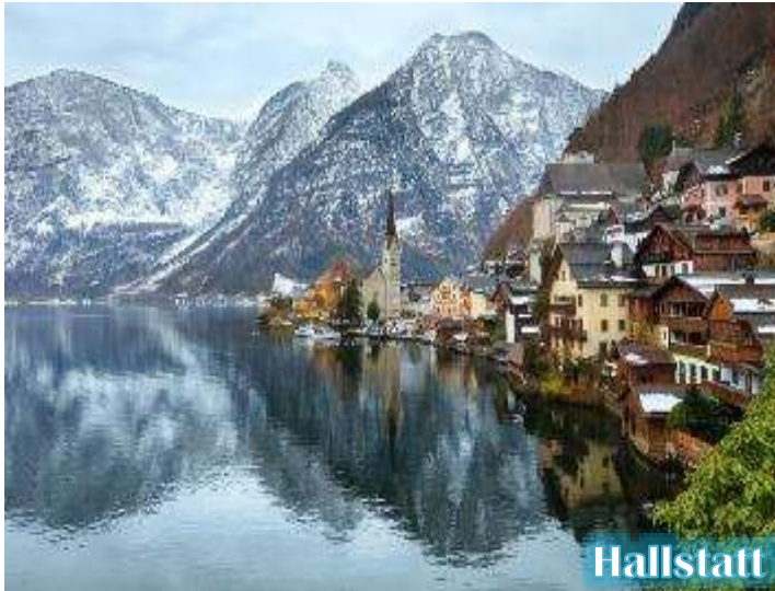
Hallstatt View point

*** บริษัทฯ ขอสงวนสิทธิ์ในการย้ายโรงแรมที่พักไปยังเมืองเซนต์ลูส์ฟิงก์ หรือ เซนต์กิลเกน (ริมทะเลสาบ) แทน ในกรณี โรงแรมในหมู่บ้านอัลด์สตัดท์เต็ม ***