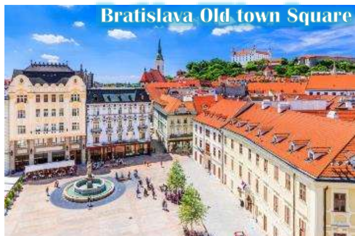
Bratislava Old town Square

บ่าย นำท่านเดินทางสู่กรุงบราติสลาวา, ประเทศสโลวัก นำท่านเข้าชมเมืองเก่าบราติสลาวา สัมผัสบรรยากาศเมืองเก่า และถ่ายภาพกับโรงละครโอเปร่า สัญลักษณ์แห่งความหรรษาของประเทศ และเก็บภาพรูปปั้นที่ซ่อนอยู่ในตัวเมือง ไม่ว่าจะเป็นรูปปั้นโปเลียนหน้าสถานทูตฝรั่งเศส หรือรูปปั้นปาปาริซซ์รวมถึง ไฮไลต์ของเมืองคือรูปปั้นของคนที่ตกท่อคูมิล” (Man at Work) ที่โด่งดัง ณ แห่งนี้เคยถูกรถชนมาแล้วถึง 2 ครั้ง ในปัจจุบันจึงมีป้าย เขียนว่า “Man at Work” ปักอยู่บริเวณดังกล่าว เป็นสัญลักษณ์ช่วงที่เป็นคอมมิวนิสต์ และตำนานยังคงกล่าวต่อไปว่าอาจจะเป็นคุณลุงที่เหน็ดเหนื่อยกับการทำงานอยากจะพักผ่อนบ้างตามประสานักงานหนัก จากนั้นนำท่านชม “ประตูไมเคิล” ซึ่งซุ้มประตูไมเคิลก่อสร้างสไตล์โกธิคสูง 51 เมตร มีอยู่ทั้งหมด 4 แห่ง ปัจจุบันเป็น ประตูเพียงแห่งเดียวที่ยังเหลืออยู่ ประตูไมเคิลมียอดโดมทรงหัวหอมตามศิลปะบารอก 3 ชั้น ลดหลั่นกัน ประตูแห่งนี้ตั้งอย่างศูนย์กลางเมืองเก่า สองฝั่งถนนมีอาคารเก่าแก่หลาก สี สัน สไตล์อาร์ตนูโวตั้งเรียงรายอยู่ทำให้บรรยากาศคึกคัก