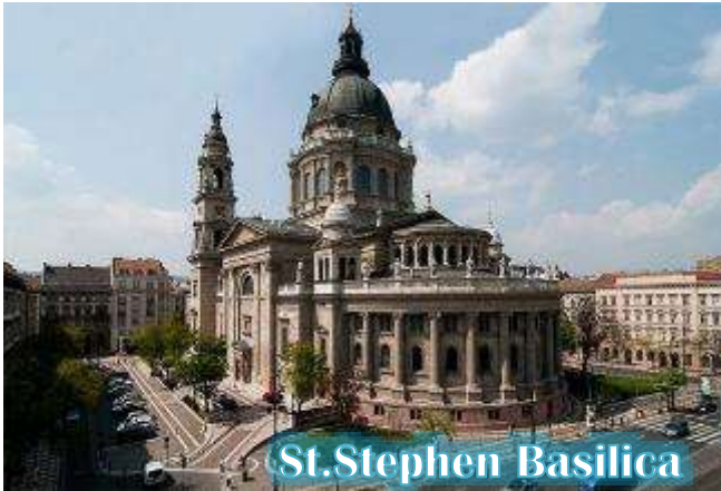
St. Stephen Basilica