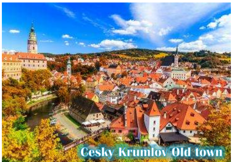
Cesky Krumlov Old town

บ่าย นำท่านเดินทางสู่ “เมืองเชสกี้ ครุมลอฟ (เมืองมรดกโลก)” เป็นเมืองขนาดเล็กในภูมิภาคโบฮีเมียใต้ของ สาธารณรัฐเช็กมีชื่อเสียงจากสถาปัตยกรรม และศิลปะของเขตเมืองเก่าและปราสาทครุมลอฟ ที่ยังคงมีเสน่ห์เหมือนอยู่ในเทพนิยายมาจนถึงทุกวันนี้ และน่าจะเป็นเมืองที่สวยงามที่สุดใน สาธารณรัฐเช็ก, เชสกี้ ครุมลอฟได้รับการจัดอันดับให้อยู่ในสิบเมืองที่สวยงามที่สุดในโลก เป็นหนึ่งในสถานที่ที่สวยงามที่สุดและไม่ควรพลาด ในการเดินทางไปสาธารณรัฐเช็ก เดินเล่นไปบนถนนในยุคกลาง ปราสาทสไตล์บาโรกที่ไม่บุบสลาย และแม่น้ำที่คดเคี้ยว เมืองเก่าที่งดงามแห่งนี้ได้รับการอนุรักษ์ไว้อย่างดีจากอดีตและการทิ้งระเบิดใน สงครามโลกครั้งที่ 2 ทั้งหมดทำให้เมืองที่มีทิวทัศน์แห่งนี้รู้สึกเหมือนอยู่ในเทพนิยายจากยุคกลางสู่ความเป็นจริง