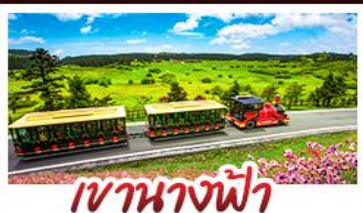
เขานางฟ้า

บินตรงสู่มหานคร 8 มิตี้อุโมงค์ รถไฟฟ้าทะลุคิก หงหยาดังยามค่ำคืบ และตื่นตาตื่นใจกับธรรมชาติสุดยิ่งใหญ่ที่อุหลง หลุมฟ้าสามสะพานสวรรค์ สวยจนต้องร้องว้าว! ให้คุณเช็กอินทุกมุมฮิต