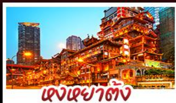
แดงยาตั้ง