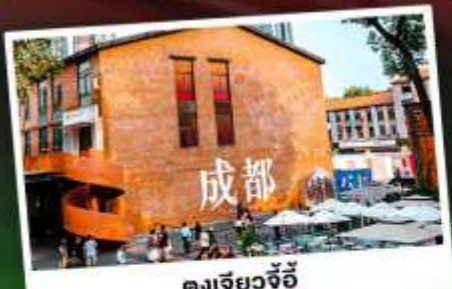
ตงเจียวจี้

เทือกเขาแอลป์แห่งเมืองจีน ชมความงามของ "อุทยานภูเขาสี่ดรุณี"