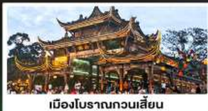
เมืองโบราณทวนเสียน