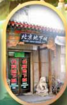
เมืองโบราณใต้ดิน