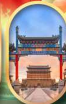
ถนนคนเดินเทียนเหมิน