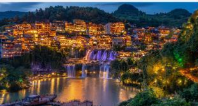
หมู่บ้านโบราณฟูหรงเจิน