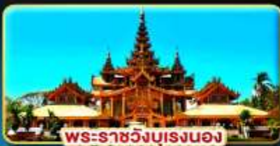
พระราชวังบุเรงนอง