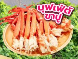
บุฟเฟ่ต์ ซาซุ