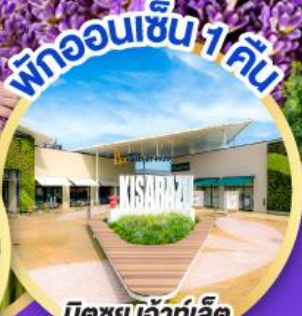
มิตซูเออิเกิ้ลิต พาร์ค คิชะระชู