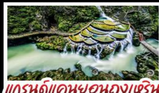
แกรนด์แคนยอนกงเหริน

เขาฟ่านจิ่ง - เมืองโบราณฝูหรงจั้น เมืองโบราณเฟิ่งหวง - เกาะส้มจิวจี้โจว แกรนด์แคนยอนกงเหริน - ไม้เข้าน้ำร้อน พักรีสอร์ท 5 ดาว - รถไฟความเร็วสูง