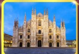
มหาวิหารแห่งเมืองมิลาน