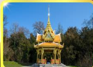
ศาลาไทยไชยานท์

GO3CDG-TG058 • ชมมหาวิหารแห่งเมืองมิลาน 8 วัน | 5 คืน