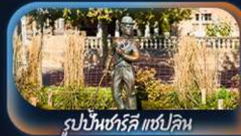
รูปปั้นซาร์ดีนี แซปลิน