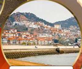
ซาร์จื่อโข่ว