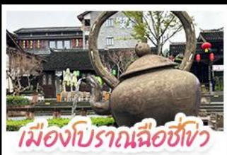
เมืองโบราณฉือซีเซว