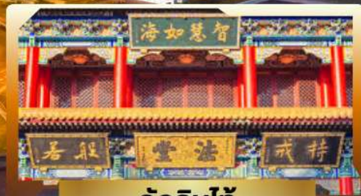
วัดจันทน์