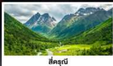
สี่ครุณี