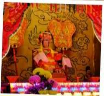
เจ้าแม่กับทิม จอสเฮาส์เบย์