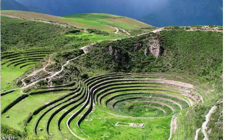
บ่าย นำท่านเดินทางสู่ มาราซ (Maras) แหล่งผลิตเกลือที่คุณภาพดีที่สุดในโลก ที่มีมาตั้งแต่สมัยอินคา แนวนาขั้นบันไดที่เรียงอยู่ตามลำดับความสูงของภูเขา จากนั้นเดินทางสู่ โมเรย์ (Moray) นาขั้นบันไดวงกลมขนาดใหญ่หลายๆรูปร่างแปลกตาที่ชาวอินคาทำไว้เพื่อทดลองปลูกพืชพันธุ์ต่างๆ จากจุดนี้สามารถมองเห็น หมู่บ้านอูรัมบัмба (Urubamba) ได้อีกด้วย ได้เวลาเดินทางกลับสู่เมือง เมืองคัสโก (Cusco) เมืองหลวงของอาณาจักรอินคา ที่แพร่ขยายอาณาจนกินพื้นที่ 1 ใน 3 ของอเมริกาใต้ ตั้งอยู่เหนือระดับน้ำทะเลถึง 3,400 เมตร และเป็นแหล่งอารยธรรมยุคก่อนประวัติศาสตร์ที่ลึกลับน่าทึ่ง เป็นชุมชนเก่าแก่ของจักรวรรดิอินคาอันรุ่งเรือง ซึ่งยังคงทิ้งร่องรอยความเจริญไว้ให้เห็นเป็นซากปรักหักพังโบราณและโบราณวัตถุต่างๆ