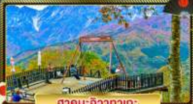
ฮาคุบะ-อิซากาตะ