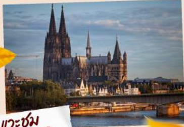
แคว้น มณฑลซาร์ดิเนีย