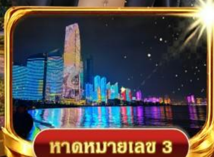
หาดหมายเลข 3