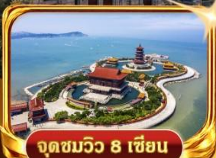
จุดชมวิวกว 8 เซียน