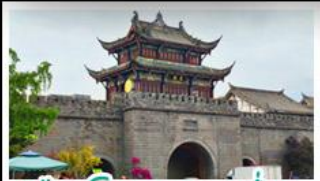
เมืองโบราณทวนเซี่ยน

ภูเขาสี่ดรุณี - อุทยานป่ฝิงโกว - สะพานหนานเฉียว - ร้านหนังสือจงซูเก๋อ - เมืองโบราณกวนเสี้ยน จตุรัสหยางเกียนหวู่ - หมีแพนด้าเซสพี - ถนนโบราณชอยกว้างชอยแคบ - ถนนคนเดินไท่กู๋หลี่ ถนนคนเดินซุนซี - ถนนโบราณจินหลี่ - แพนด้ายักษ์เป่ตัก - น้ำพุไม้ไผ่ตักSKP - วัดต้าอ้อ