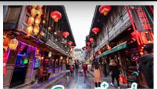
ถนนโบราณจินหลี่