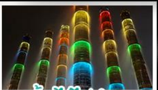
น้ำพุไม้ไผ่ตักSKP