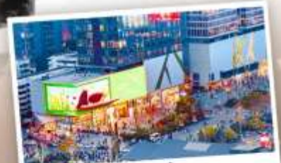
ถนนโทกู๋หลี่หลิน