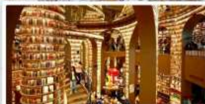
ร้านหนังสือจงซูเก๋อ

เดินทางโดย: สายการบินเจียงตูแอร์ไลน์ (EU)