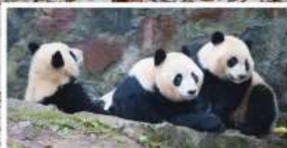
หุบเขาแพนด้า