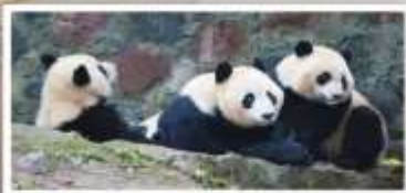
หุบเขาแพนด้า